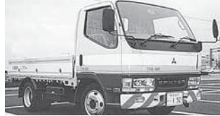
ボディー色／黄+白、バンパー色／赤+白