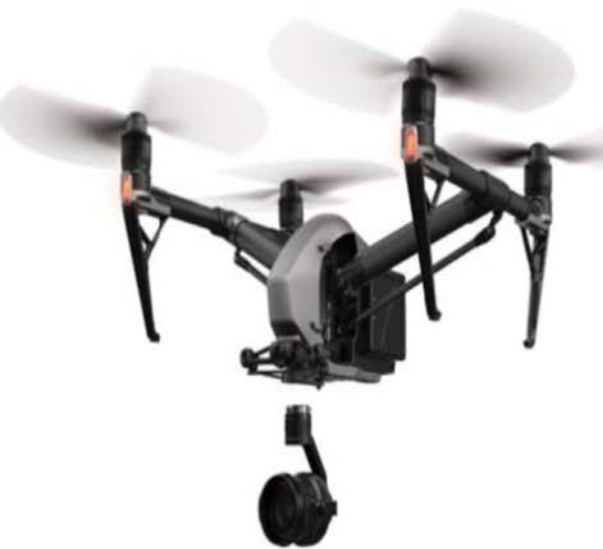
Inspire 2 Premium Combo